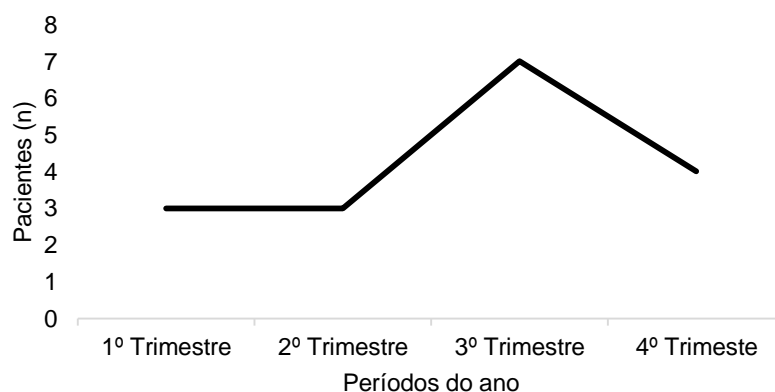
Figura 3- Distribuição dos pacientes com Anemia Ferropriva em relação ao período do ano.

Quanto à disposição da realização dos exames de Ferro e/ou Ferritina seguidos de Hemograma de acordo com os períodos e estações do ano, observou-se uma distribuição homogênea: considerou-se o primeiro trimestre como verão, onde 28,6% da população realizou os exames (81/283), o segundo como outono, com 21,9% da população (62/283), o terceiro como inverno, com 25,4% (72/283) e o último trimestre como primavera, onde 24,1% da população realizou os exames (68/283). A Anemia Ferropriva se fez mais presente no inverno, ou terceiro trimestre, com uma prevalência de 41,2% (7/17), como é possível visualizar na figura 3, mas não houve diferença estatística dos outros períodos pelo teste de associação de Qui-Quadrado ( p = 0,466 ).