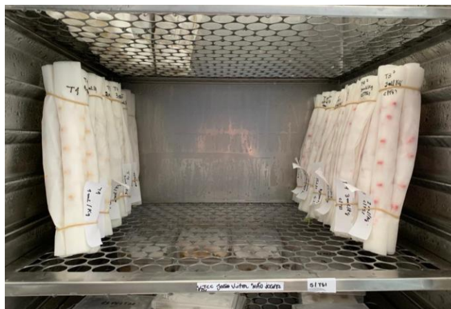
Figura 2. Posicionamento dos tratamentos em rolos em papel para germinação, na estufa Mangelsdorf.